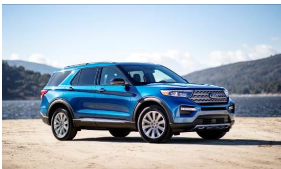
フォードの新型「エクスプローラーハイブリッド」

当社は、今後もリチウムイオン電池パックや電池モジュールなど、電池製品の強化を通じて、カーメーカーにおける電動車両の普及に寄与するとともに、環境保全にも貢献していきます。