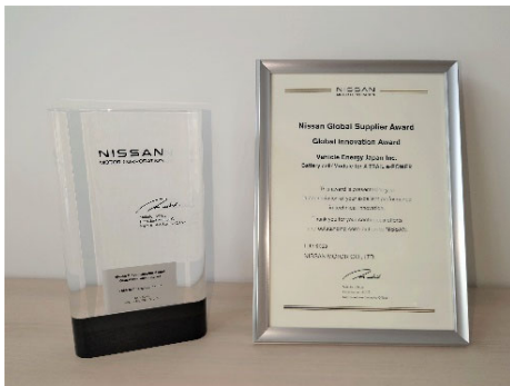
「Global Innovation Award」記念の盾と賞状

当社は、今後もリチウムイオン電池システム、パックおよび電池モジュールなど、電池製品の強化を通じて、カーメーカーにおける電動車両の普及と地球環境の保全に貢献してまいります。