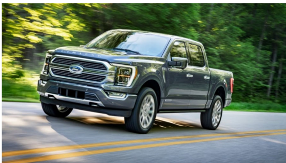
All-new Ford F-150

当社は、今後もリチウムイオン電池パックや電池モジュールなど、電池製品の強化を通じて、カーメーカーにおける電動車両の普及に寄与するとともに、環境保全にも貢献していきます。